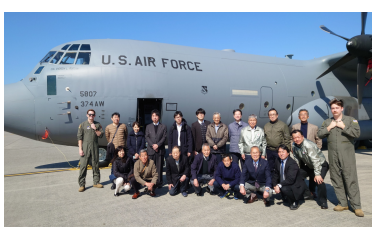
米軍機、米軍兵士とともに記念撮影

あきる野市は平成7年に秋川市と五日市町が合併し、令和7年に市制施行30周年を迎えました。